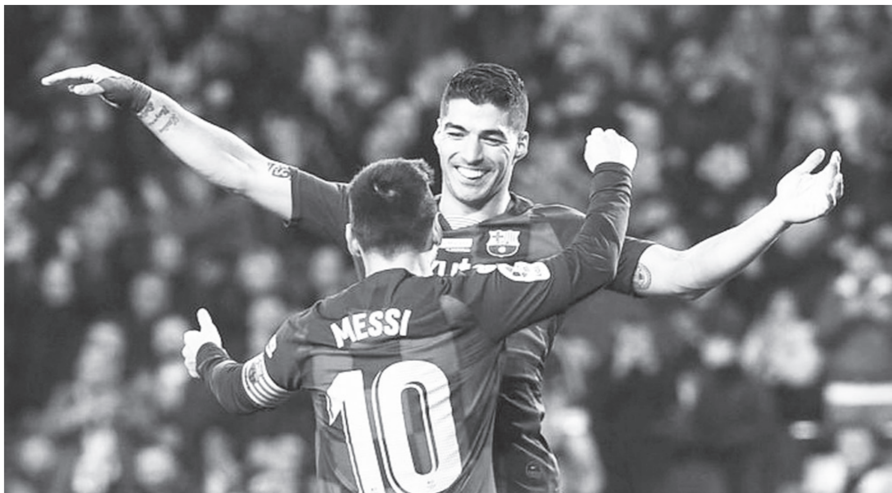
Usai saga Lionel Messi berakhir, Barcelona masih dihadapkan spekulasi soal masa depan Luis Suarez

Baca juga: Messi Bertahan Meski Barcelona Ingkar Janji Suarez ramai diberitakan akan menuju Juventus. Namun, kepindahan pesepakbola berusia 33