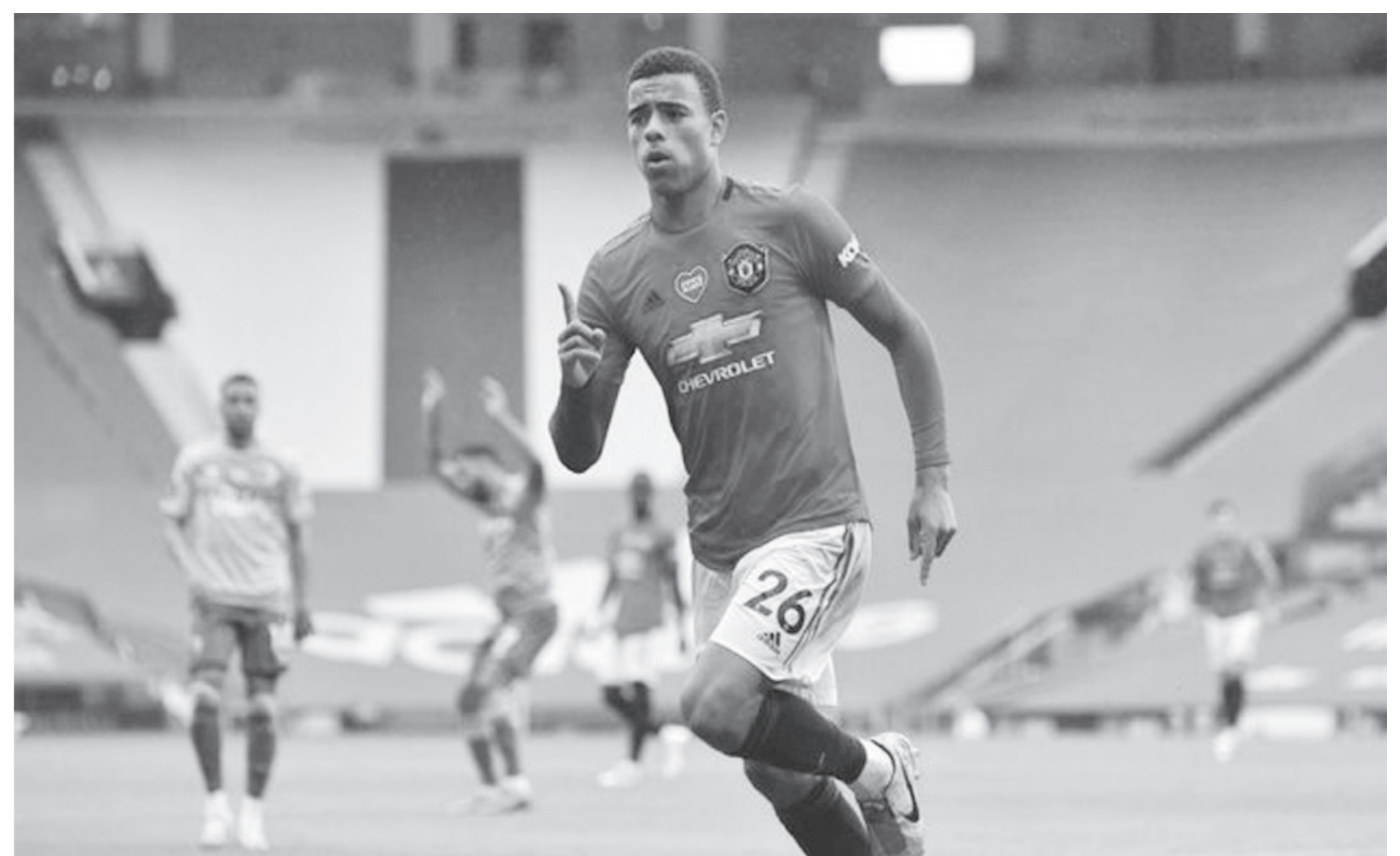
Harry Kane kagumi bakat Mason Greenwood yang disebutnya sebagai penyerang yang lengkap

Namun setelah saya melihat dia dalam waktu singkat, ia melakukan penyelesaian akhir dengan cara yang berbeda-beda. Ia menggunakan kaki kiri, kaki kanan, lewat kaki bagian dalam dan dengan tembakan kencang,"