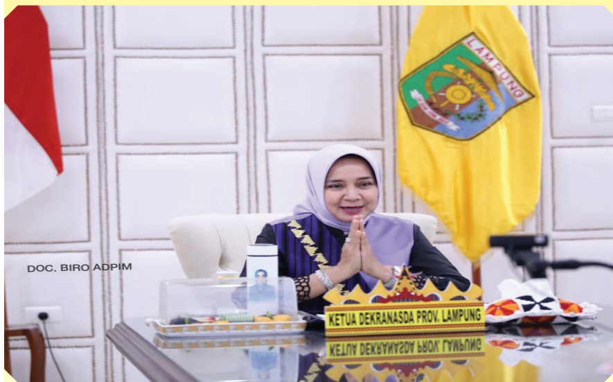
DOC. BIRO ADPIM