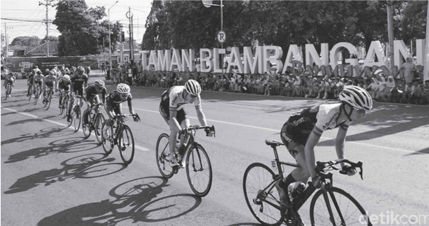
Balap sepeda masih diperjuangkan tampil di PON 2020

Jakarta (FN) Pengurus Besar Ikatan Sport Sepeda Indonesia (PB ISSI) masih berambisi balap sepeda diper-