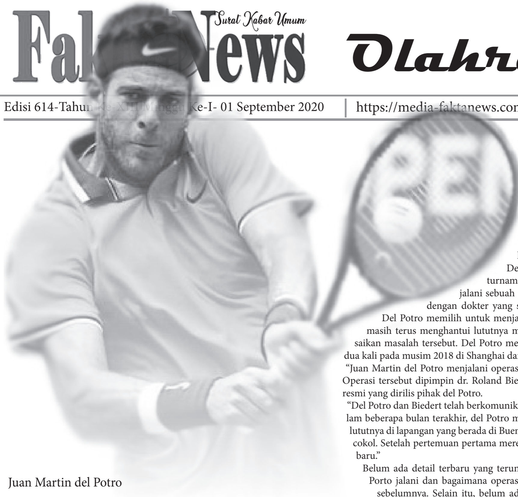
Juan Martin del Potro