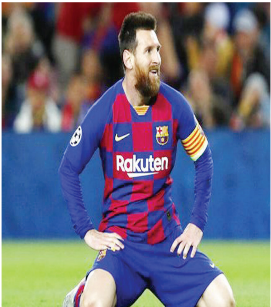
Lionel Messi kabarnya ingin hengkang dari Barcelona, dan dikaitkan dengan sejumlah klub, termasuk Liverpool.

Liverpool dinilai tidak akan ikut memburu Lionel Messi, yang kabarnya ingin hengkang dari Barcelona. Ada dua alasannya, pertama disebut soal uang. Lalu?