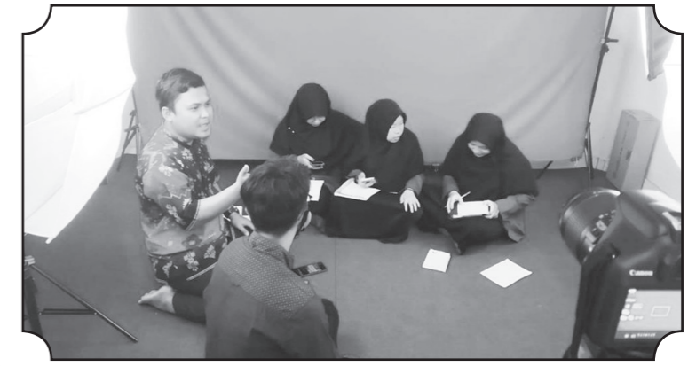
TIGA MAHASISWA UMKO IKUTI KDMI