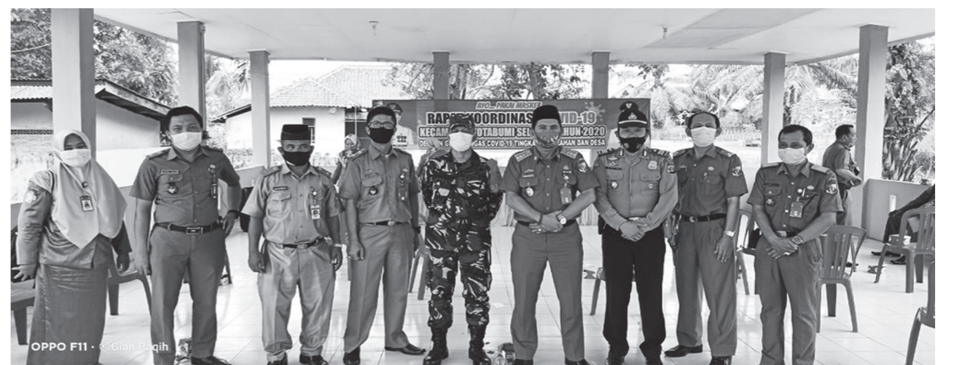
Lampung Utara (FN)

Meningkatnya kasus terkonfirmasi positif virus corona di Kabupaten Lampung Utara, Pemerintah Kecamatan gelar rapat koordinasi covid 19 mengenai penanganan pasien yang menjalani isolasi mengingat tempat yang disediakan pemerintah cukup terbatas.